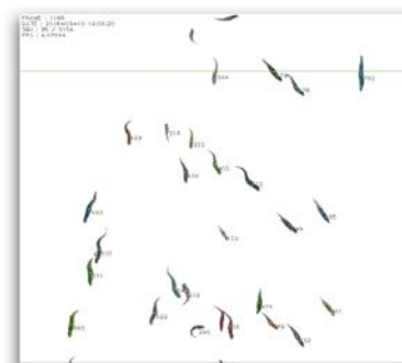
Видео фиксация и контроль

Фотографии и технические данные не являются обязательными. FAIVRE Sas может в любое время внести изменения в свое оборудование.